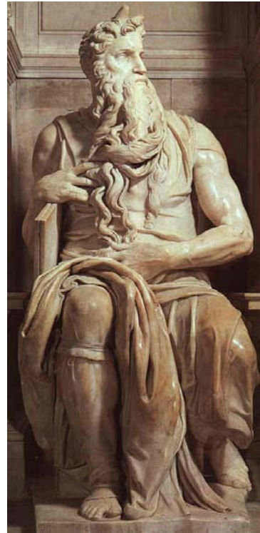
Moisés (1306-1186 a.C.)